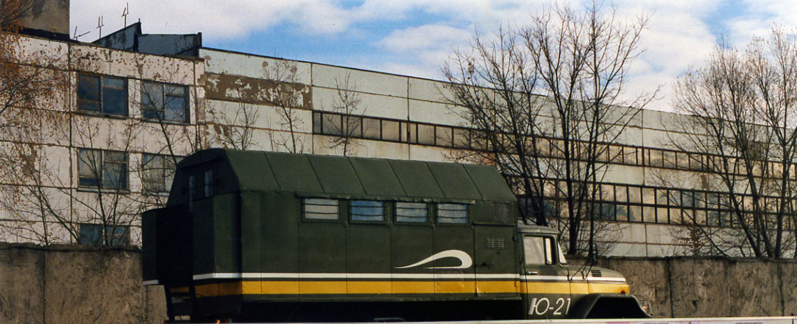
КОМПАНИИ ПАСАЖИРСКИХ ВОЗДУШНЫХ КОМПЛЕКСОВ